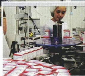
Verpackung von Pharmadosen in Faltschachteln

bunden. Dazu gehören auch sehr gute Produkt- und Fertigungskennnisse, moderne Technik und eine hohe Flexibilität bei kurzen Vorlaufzeiten.